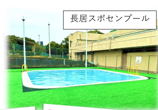
長居スポセンプール

8月は天候にも恵まれ、とけいワニでのプールと長居スポーツセンターのプール遊びを予定通りに行うことができました。連日のプールの準備、ありがとうございました。